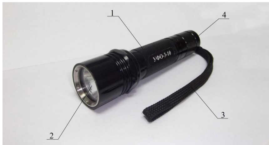
Рис. 2.1 Внешний вид облучателя

2.3 Конструктивно облучатель выполнен (см. рис. 2.1) в легком дюралюминиевом корпусе 1, в передней части которого находится отражатель 2 с ультрафиолетовым светодиодом. Корпус снабжен ремешком для переноски 3. На нем также расположена кнопка 4 включения/выключения питания.